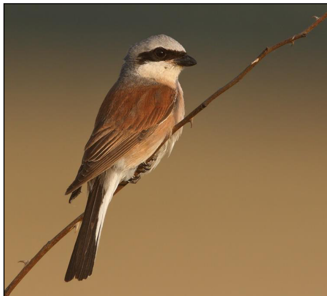
Männlicher Neuntöter

Aufgrund der generell zunehmenden Intensivlandwirtschaft auf breiter Fläche und des dadurch bedingten Verlusts an insektenreichem Grünland, das an Heckenzüge in geeigneter Ausprägung angrenzt, ist langfristig ein Negativtrend der Bestände zu erwarten.