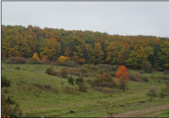
Strukturreiche Halboffenlandschaft bei Sontra im Werra-Meißner-Kreis

Mit Einzelbüschen, höheren Warten und einer niedrigen Vegetation stellt das oben gezeigte Revier ein Primärhabitat dar. Die Waldrandnähe schmälert die Attraktivität des Standortes nicht. Präventiv sind derartige Übergangshabitate zu erhalten und harte Wirtschaftsgrenzen (Forstkultur, Agrarkultur, Intensiv-Grünland) zu vermeiden.