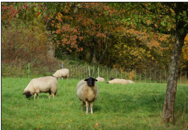
Schafbeweidung am Habelberg bei Tann in der Rhön

Beweidungsmaßnahmen tragen grundsätzlich, in sanfter aber effektiver Art und Weise, zur Offenhaltung/Pflege von Neuntöter-Habitaten bei. Potenzielle Störungen werden möglichst gering gehalten und eine Flächenpflege gleichzeitig gewährleistet. In den Wintermonaten sollte die Pflege von Büschen und Hecken ggf. unter Zuhilfenahme von Arbeitsgeräten erfolgen (u.a. für Entbuschung).