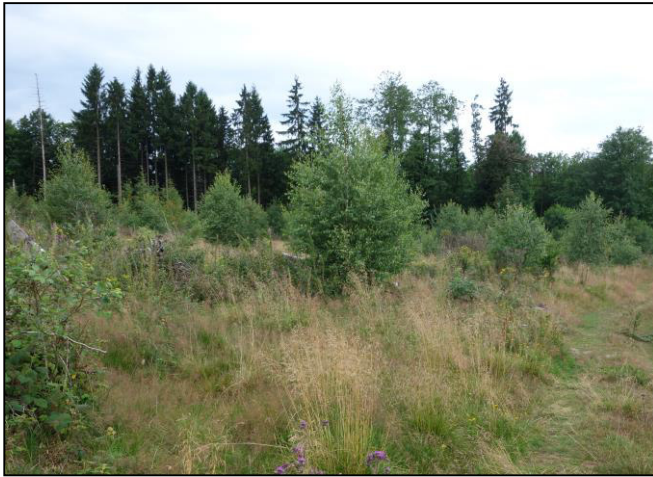
Windwürfe (hier bei Angelburg/MR) werden als Sekundär-/Primärhabitat immer essenzieller