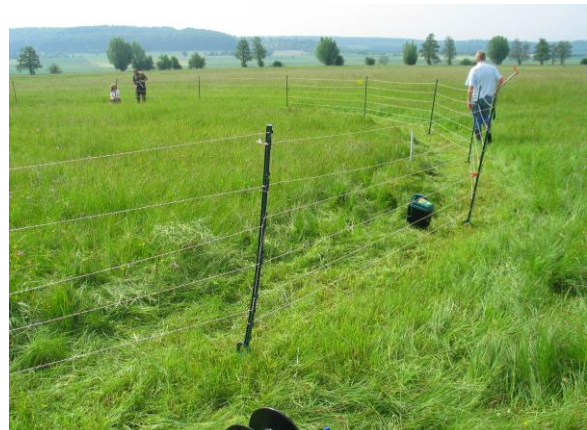
Gelegeschutz mit Elektrozaun hält Prädatoren fern