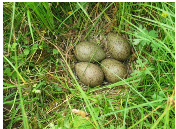
Gelege des Großen Brachvogels