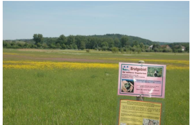
Besucherlenkung zur Vermeidung bzw. Reduzierung von Störungen im NSG Mittlere Horloffau/Kreuzquelle

Maßnahmen sollten in eine flächige Extensivierung der Grünlandnutzung mit später Mahd, Verzicht auf Düngung oder Ausbringung von Gülle und auch einen Verzicht auf Pestizide im Umfeld eingebunden sein.