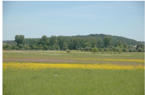
Optimallebensraum im NSG Mittlere Horloffau/Kreuzquelle

Als Durchzügler ist die Art neben den genannten Lebensräumen auch oft auf Schlammflächen, Schlammteichen und auf Ackerflächen anzutreffen.