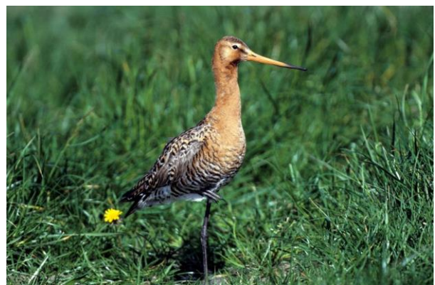
Von Maßnahmen für den Brachvogel profitiert auch die Uferschnepfe

Bearbeiter: Stefan Stübing (BFF) , Gerd Bauschmann (VSW)