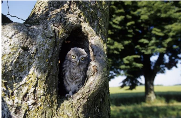
Alte Hochstamm-Obstbäume mit Höhlen sind ideale Fortpflanzungs- und Ruhestätten hessischer Steinkäuze (Foto: A. Limbrunner/Archiv VSW).