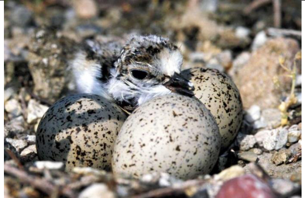
Eben geschlüpfter Flussregenpfeifer.

Nach Beendigung des Abbaus hört die Bodenverwendung durch Maschinen in den Sand- und Kiesgruben abrupt auf und sehr schnell setzt ein Bewuchs mit Pflanzen ein. Die Flächen sind oftmals bereits im nächsten Jahr für den Flussregenpfeifer als Brutgebiet ungeeignet.