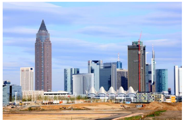
Großflächige Baustellen (hier ehemalige Bahnfläche in Frankfurt) sind Lebensraum des Flussregenpfeifers

Die Besiedlung von Baustellen und Brachflächen im besiedelten Bereich lässt sich nicht verhindern. Dennoch genießen die Bruten absoluten Schutz durch das BNatSchG. Brutplätze müssen zum Schutz vor Zerstörung entsprechend z. B. durch Einzäunung, abgesichert werden.