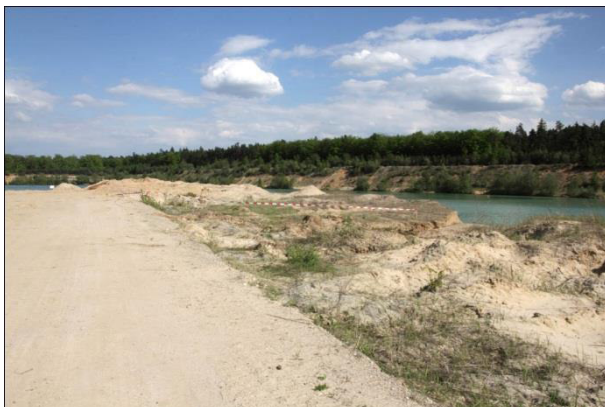
Brutplatz des Flussregenpfeifers in einem Kies-/Sandgrubengelände.

Gleichzeitig nimmt der Störungsdruck in den verbliebenen Bereichen stetig zu.