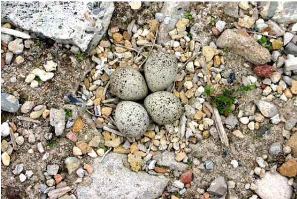
Nistmulde mit Gelege des Flussregenpfeifers.

Da häufige Störungen in den Freizeitgebieten wie Flüssen und Baggerseen an der Tagesordnung sind, müssen die Brutplätze effektiv gesichert werden. In der Regel ist eine Einzäunung unvermeidbar, was den Bürgern mit Schildern und Infotafeln eindrücklich erklärt werden muss.