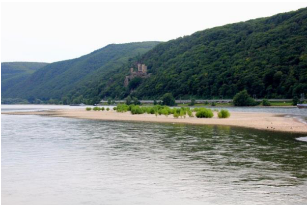
Kiesinsel im Mittelrhein bei Lorch, ein natürlicher Lebensraum des Flussregenpfeifers.

Die Art ist ursprünglich ein Bewohner offener dynamischen Auen größerer Flüsse und Ströme, also von Bereichen, in denen jährlich durch Hochwasser Substratumlagerungen stattfinden. Auf den dabei entstehenden, weitgehend vegetationsfreien Kiesbänken und Schotterinseln legt der Flussregenpfeifer sein Nest an und zieht die Jungen groß. Da sein Lebensraum stetigen Veränderungen unterliegt, ist er gezwungen neu entstandene Flächen schnell zu besiedeln.